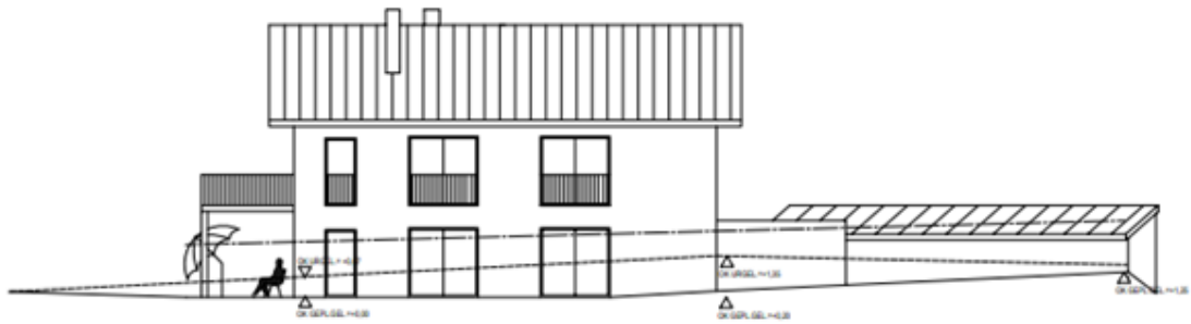
ansicht von süden