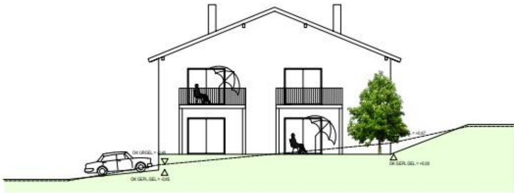
ansicht von westen