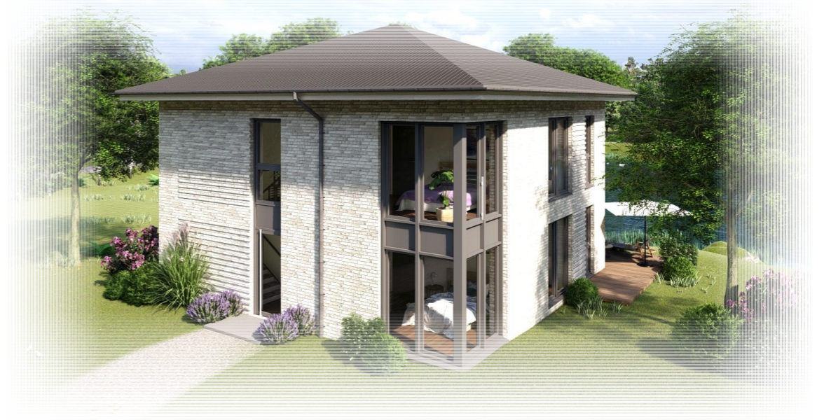
Ansicht von Osten