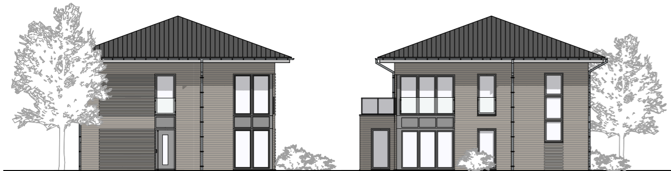
Ansicht von Norden