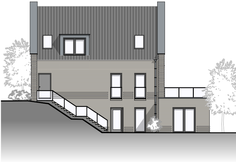
Ansicht von Sueden