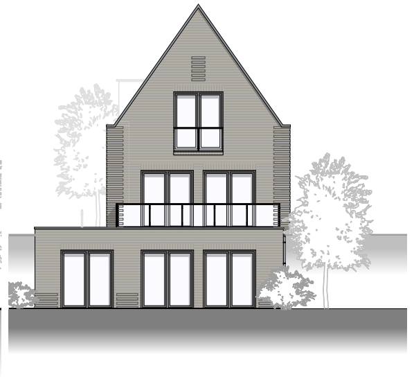
Ansicht von Osten