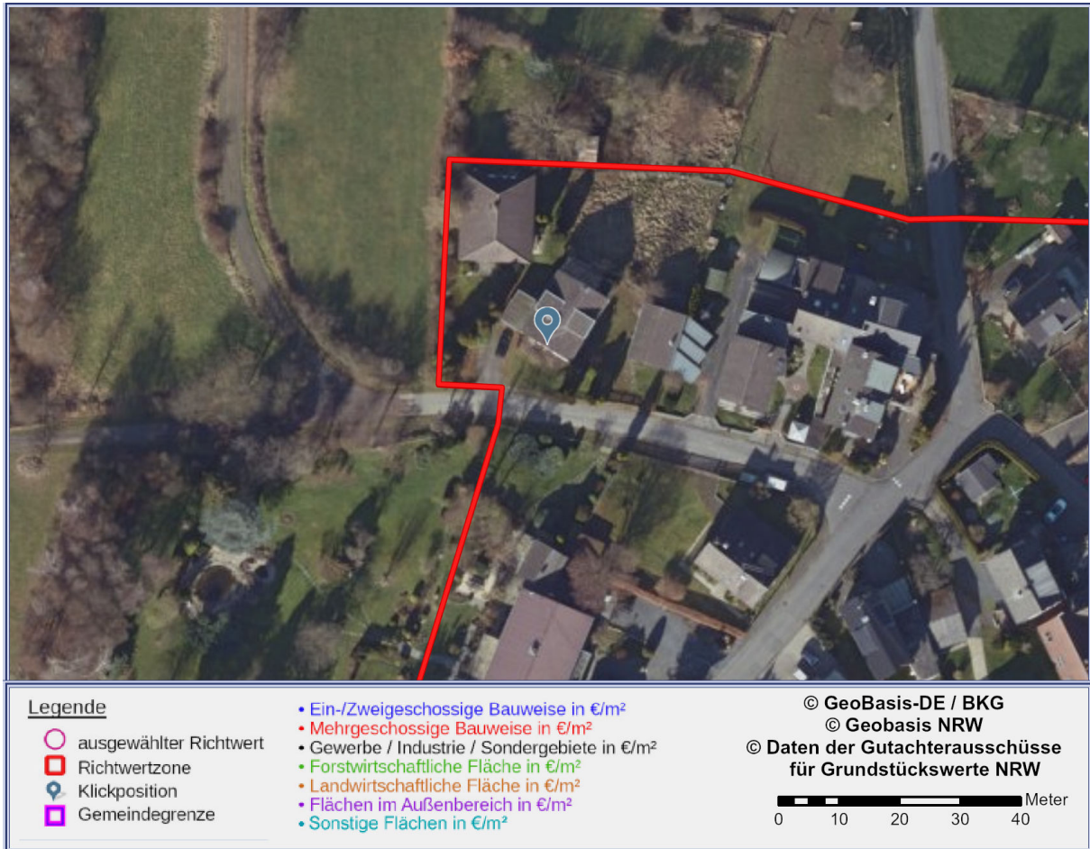
Abbildung 2: Detailkarte gemäß gewählter Ansicht