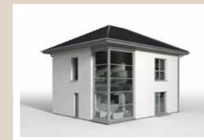
GESCHOSSÜBERGREIFENDE ECKVERGLASUNG 3,00 x 2,00 m