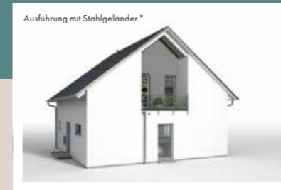
LOGGIA KLEIN Breite 3,15 m, Tiefe 1,20 m