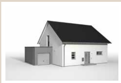
GARAGENANBAU KLEIN mit Flachdach, 6,442 x 3,60 m (nicht begehbar oder begehbar möglich)