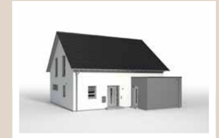
TECHNIKBAUSTEIN 4,642 x 3,00 m (nicht begehbar oder begehbar möglich)