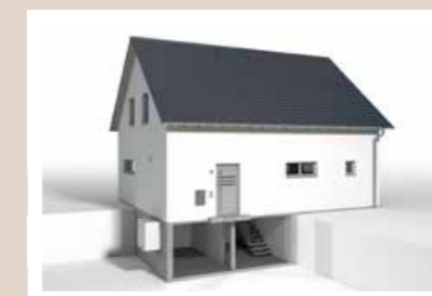
VORTEILSKELLER 5,612 x 5,40 m