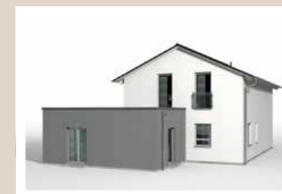
ECKBAUTEIL mit Flachdach, 7,94 x 5,54 m