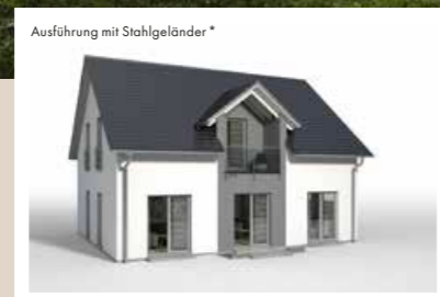
ZWERCHGIEBEL mit Satteldach und Loggia, bündig, Breite 3,442 m weitere Breiten: 4,042 m, 4,642 m weitere Tiefen: 0,60 m, 0,90 m, 1,20 m