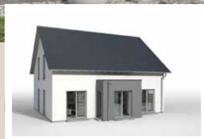
RECHTECKERKER traufseitig, mit Attika und Flachdach, 1,20 x 4,042 m weitere Breiten: 4,642 m, 5,242 m weitere Tiefen: 1,60 m, 2,20 m