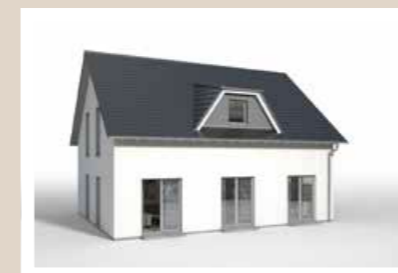
1-FENSTER TRAPEZDACHGAUBE Breite: ca. 4,66 m