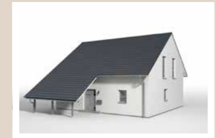
CARPORT mit Dachabschleppung, 6,00 x 3,00 m