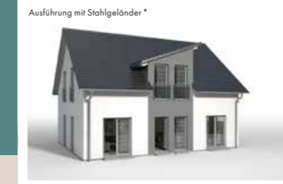
ZWERCHGIEBEL mit Pultdach, wandbündig, Breite 3,442 m weitere Breiten: 4,042 m, 4,642 m