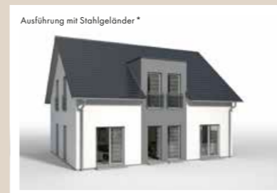
ZWERCHGIEBEL mit Flachdach, wandbündig, Breite 3,442 m weitere Breiten: 4,042 m, 4,642 m