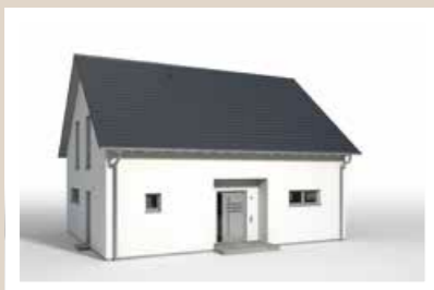
ZURÜCKLIEGENDER EINGANG Breiten: 1,95 m, 2,55 m, 3,15 m, 4,80 m Tiefen: 0,60 m, 0,90 m, 1,20 m