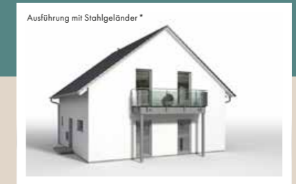
HOLZBALKON Breiten: ca. 3,50 m, 4,00 m, 4,50 m, 5,80 m Tiefen: 1,20 m, 1,80 m, 2,20 m