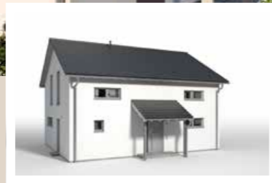
VORDACH geneigt 3,00 x 2,10 m oder 4,20 x 2,10 m