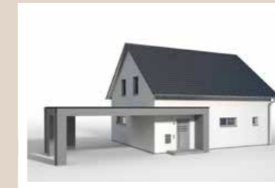
CARPORT und Hauseingangsüberdachung mit Flachdach und Attika groß, 10,62 x 6,36 m