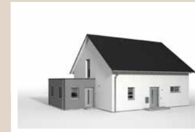
BÜROANBAU KLEIN mit Flachdach, 6,442 x 3,60 m (nicht begehbar oder begehbar möglich)