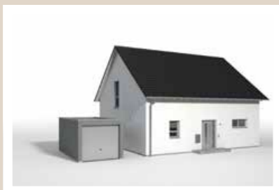
FERTIGGARAGE als Einzelgarage