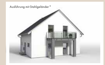
PUTZBALKON Breiten: ca. 2,40 m, 3,60 m, 4,38 m Tiefen: 1,20 m, 1,80 m, 2,30 m