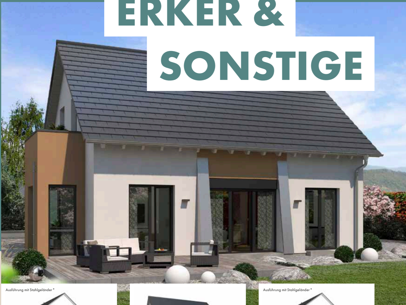
Ausführung mit Stahlgeländer *

Beim Neubau eines Hauses spielen Erker, Keller und großflächige Verglasungen eine wichtige Rolle. Erker erweitern den Wohnraum und schaffen eine angenehme Atmosphäre mit zusätzlichem Tageslicht. Keller bieten nicht nur zusätzlichen Stauraum, sondern auch Platz für technische Anlagen und schützen das Haus vor Feuchtigkeit. Großflächige Verglasungen verbessern nicht nur die Ästhetik, sondern maximieren auch den Lichteinfall und bieten einen unvergleichlichen Ausblick auf die Umgebung. Diese Bauteile tragen nicht nur zur Funktionalität des Hauses bei, sondern auch zu seinem Gesamterscheinungsbild und seiner Wertsteigerung.