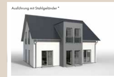
ZWERCHGIEBEL mit Flachdach, vorgezogen, 0,90 x 3,442 m weitere Breiten: 4,042 m, 4,642 m weitere Tiefen: 0,60 m, 1,20 m