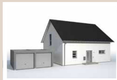
FERTIGGARAGE als Doppelgarage