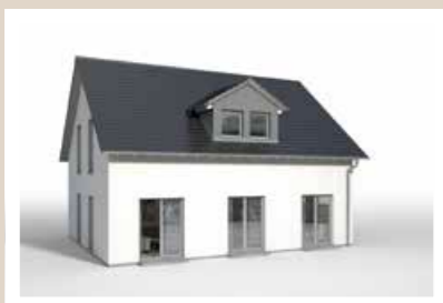
2-FENSTER SATTELDACHGAUBE Breite: ca. 3,04 m