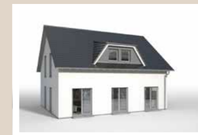
2-FENSTER TRAPEZDACHGAUBE Breite: ca. 5,60 m