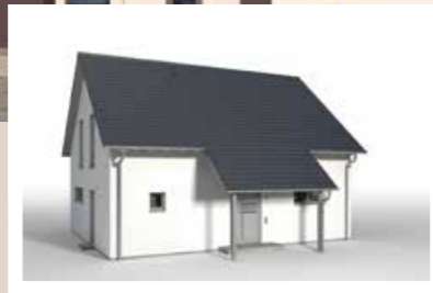
DACHABSCHLEPPUNG traufseitig, Breite 3,00 m, Tiefe ca. 2,10 m weitere Breiten: 3,60 m, 4,20 m, 4,80 m traufseitig, Breite 4,80 m, Tiefe ca. 2,60 m weitere Breiten: 5,40 m, 6,00 m, 6,60 m