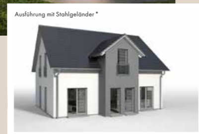
ZWERCHGIEBEL mit Satteldach, vorgezogen, 0,90 x 3,442 m weitere Breiten: 4,042 m, 4,642 m weitere Tiefen: 0,60 m, 1,20 m