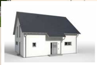
HAUSEINGANGSÜBERDACHUNG traufseitig, Breite 3,00 m, Tiefe ca. 2,60 m weitere Breiten: 3,60 m, 4,20 m, 4,80 m