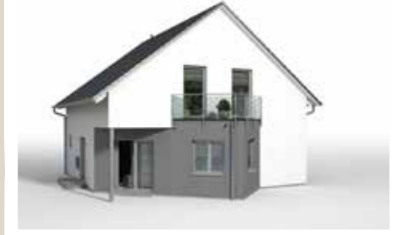
DREIECKERKER mit Balkon und mit Eckterrasse, 7,10 x 3,10 m