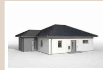
TECHNIKBAUSTEIN Bungalow, 4,642 x 3,00 m