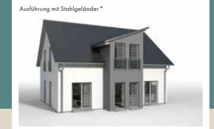
ZWERCHGIEBEL mit Pultdach, vorgezogen, 0,90 x 3,442 m weitere Breiten: 4,042 m, 4,642 m weitere Tiefen: 0,60 m, 1,20 m