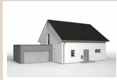
GARAGENANBAU GROSS mit Flachdach, 6,442 x 6,30 m (nicht begehbar oder begehbar möglich)