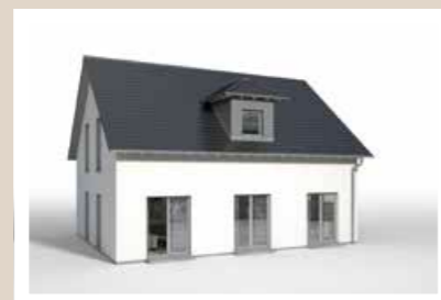
1-FENSTER WALMDACHGAUBE Breite: ca. 2,00 m