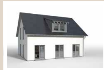
2-FENSTER SCHLEPPDACHGAUBE Breite: ca. 3,04 m