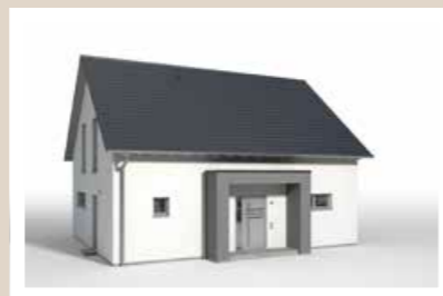
HAUSEINGANGSÜBERDACHUNG mit Flachdach/zweiseitig Breiten: ca. 2,84 m, 4,04 m Tiefen: 0,56 m, 0,86 m, 1,16 m