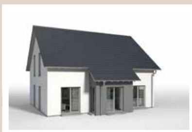
TRAUFERKER 0,80 x 4,042 m weitere Breiten: 4,642 m, 5,242 m Tiefe abhängig vom Kniestock