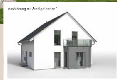
RECHTECKERKER giebelseitig, 1,20 x 4,042 m (begehbar) weitere Breiten: 4,642 m, 5,242 m weitere Tiefen: 1,60 m, 2,20 m