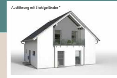
LOGGIA GROSS Breite 5,55 m, Tiefe 1,20 m