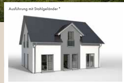
ZWERCHGIEBEL mit Satteldach, bündig, Breite 3,442 m weitere Breiten: 4,042 m, 4,642 m