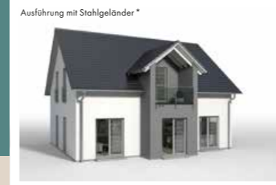
ZWERCHGIEBEL mit Satteldach und Loggia, vorgezogen, 0,90 x 3,442 m weitere Breiten: 4,042 m, 4,642 m weitere Tiefen: 0,60 m, 1,20 m