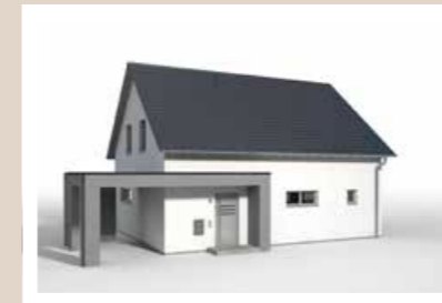
CARPORT und Hauseingangsüberdachung mit Flachdach und Attika klein, 7,84 x 6,36 m